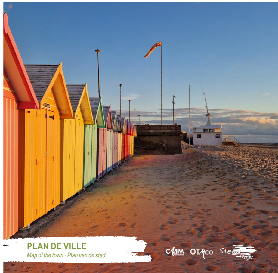
PLAN DE VILLE Map of the town - Plan van de stad