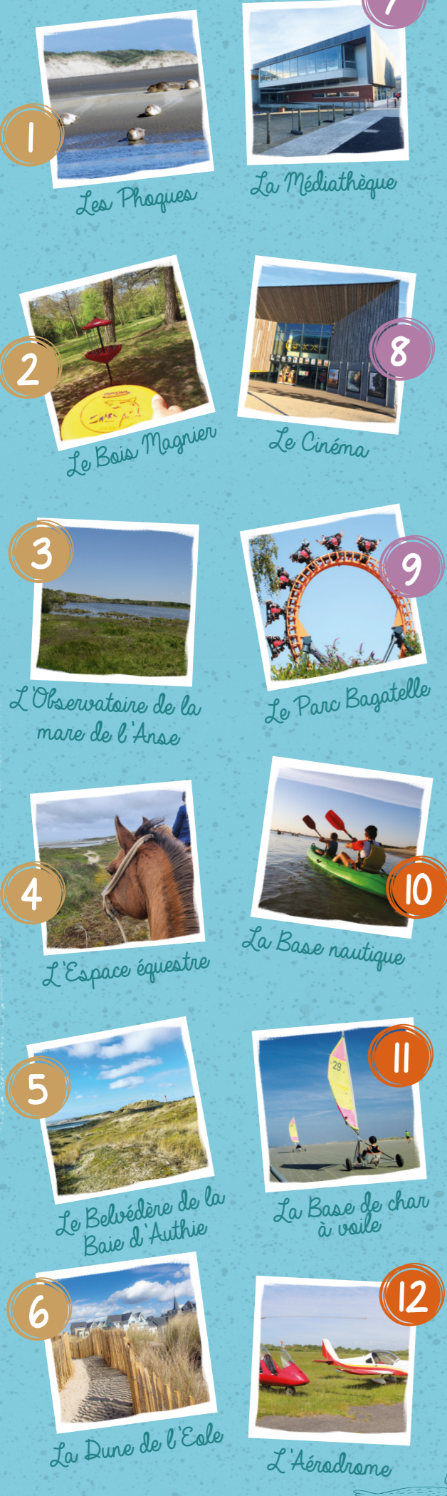
1 Les Phoques 2 Le Bois Magnier 3 L'Observatoire de la mare de l'Anse 4 L'Espace équestre 5 Le Belvédère de la Baie d'Authie 6 La Dune de l'Esle 7 La Médiathèque 8 Le Cinéma 9 Le Parc Bagatelle 10 La Base nautique 11 La Base de char à voile 12 L'Aérodrome 13 Le Parc des Sports 14 La Piscine 15 Le Casino 16 La Kursaal 17 Le Musée 18 Le Phare 19 L'Église Notre Dame des Sables 20 L'Église St Jean-Baptiste 21 Le Quartier de Thamel 22 Le Familia Théâtre